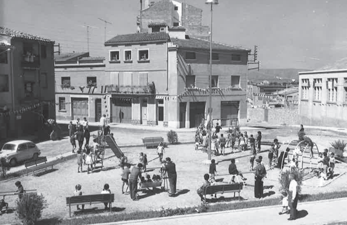
Plaça Mallorca, 1963.