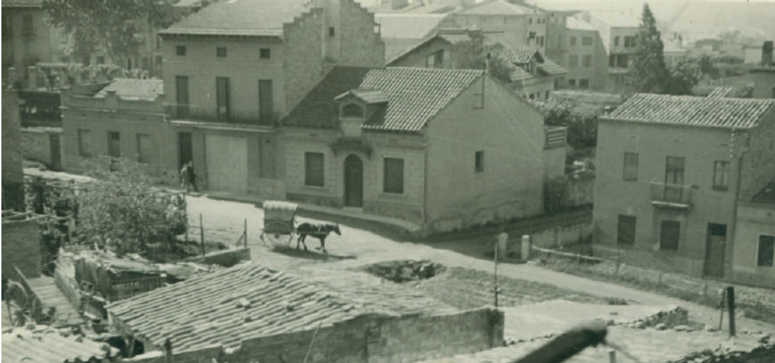
Un carrer del barri amb la tartana de Cal Busquets, anys 50

que s'havia obert, i també pels voltants de la plaça Mallorca.