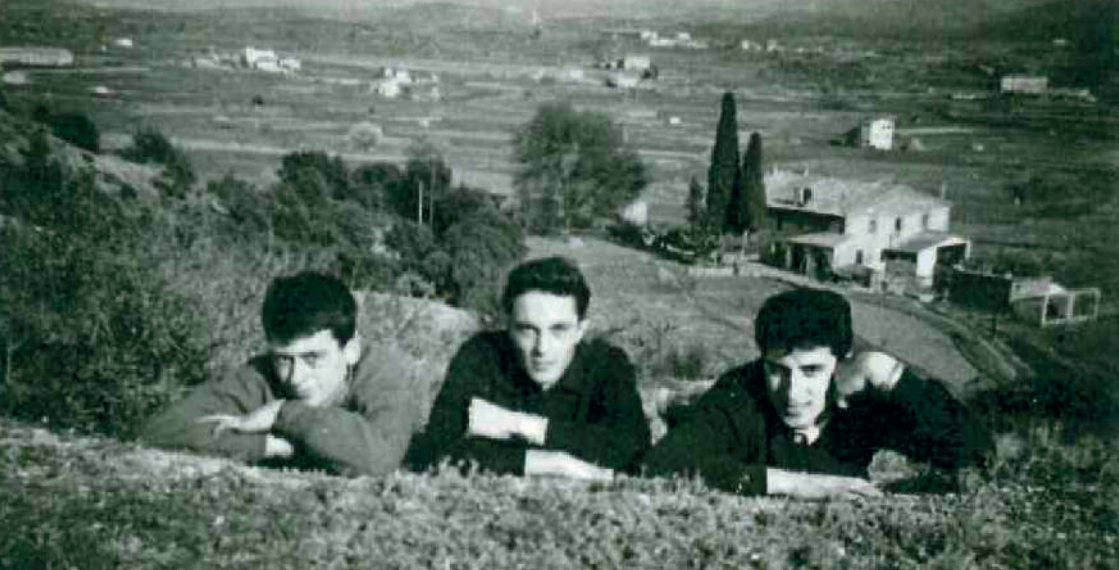
Can Font amb la masia al fons, 1956.