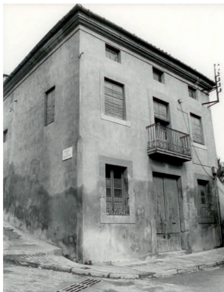
A dalt, C/ Séquia. 1969, amb els Dipòsits a l'esquerra A sota, la casa del sequiàire al costat dels Dipòsits