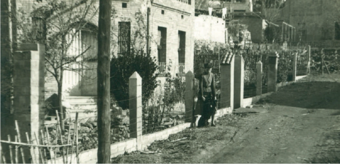
A la pàgina anterior, Cal Barbé, al c/Dr. Fleming, construïda el 1928 A sobre, c/Balmes, anys 50

També la part posterior dona a un pati privat. La façana sol presentar, moltes vegades, una entrada central amb dues finestres laterals, un primer pis amb un balcó central i dues finestres laterals. La part superior de la façana se sol acabar amb alguna forma geomètrica i algunes obertures circulars o d'ulls de bou.