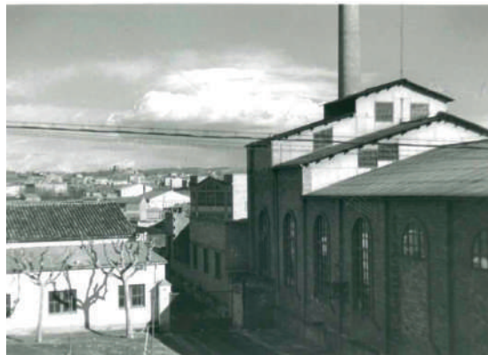
Ctra. Santpedor amb l'antiga escola Montserrat al mig, situat on és ara l'AV (Fons de la Parròquia de Sant Pere Apòstol). Estació Manresa Alta i la Fàbrica de l'Alcoholera (Fotos de Joan Guitart, cedides per Miracle Esparrica)