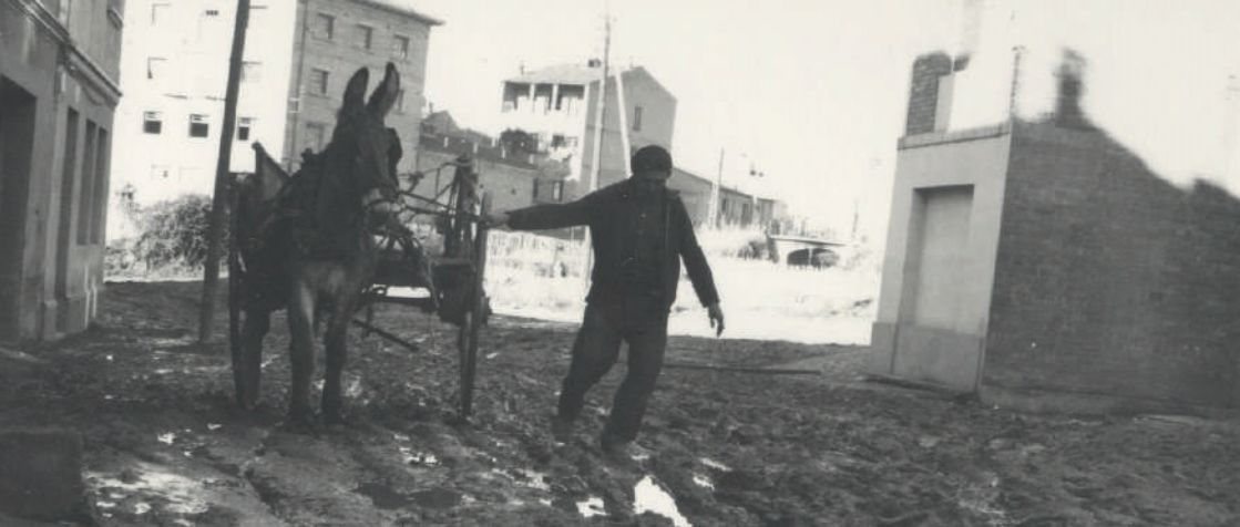
A l'esquerra, foto aèria, 1956